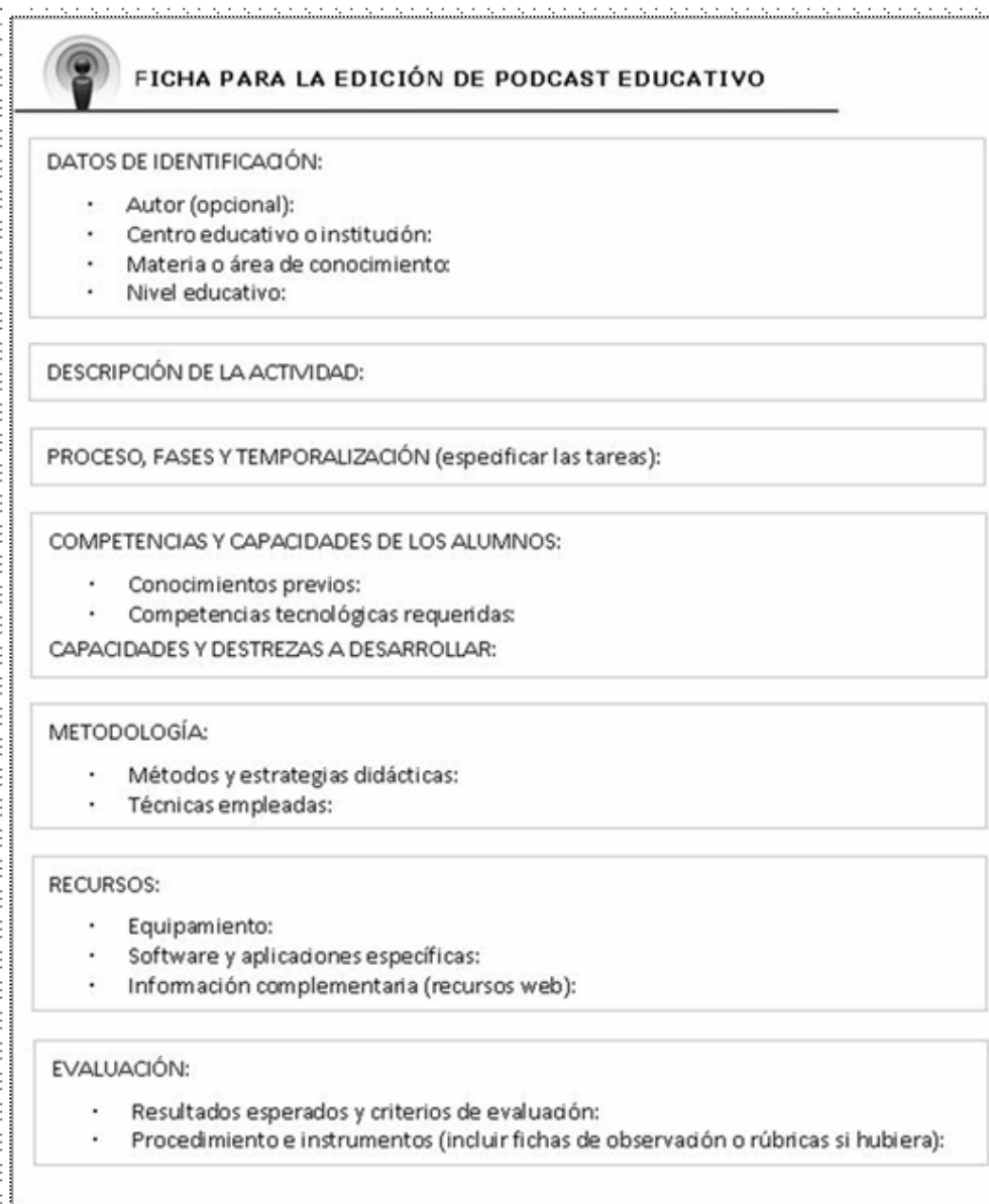
Figura nº 2: Ficha para la edición de podcast educativo.